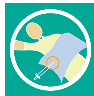
Figura 2: Procedimiento de toma de una biopsia.

Se toma con todos los cuidados que exige una cirugía ambulatoria menor: limpieza estricta de la zona de donde se va a tomar la biopsia. Si la biopsia es de piel, de partes superficiales o mucosas, se aplica anestesia (generalmente local). Todos los instrumentos que se usan en el procedimiento son estériles y el médico siempre usa guantes. Figura 2.