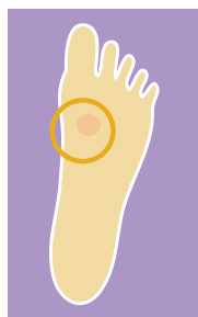
Figura 1: sitio previamente seleccionado para la toma de la biopsia.

Es un procedimiento por el cual se obtiene un fragmento de tejido vivo de cualquier parte del cuerpo. Figura 1.